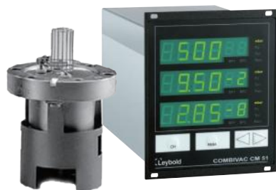
IE 514 + CM52